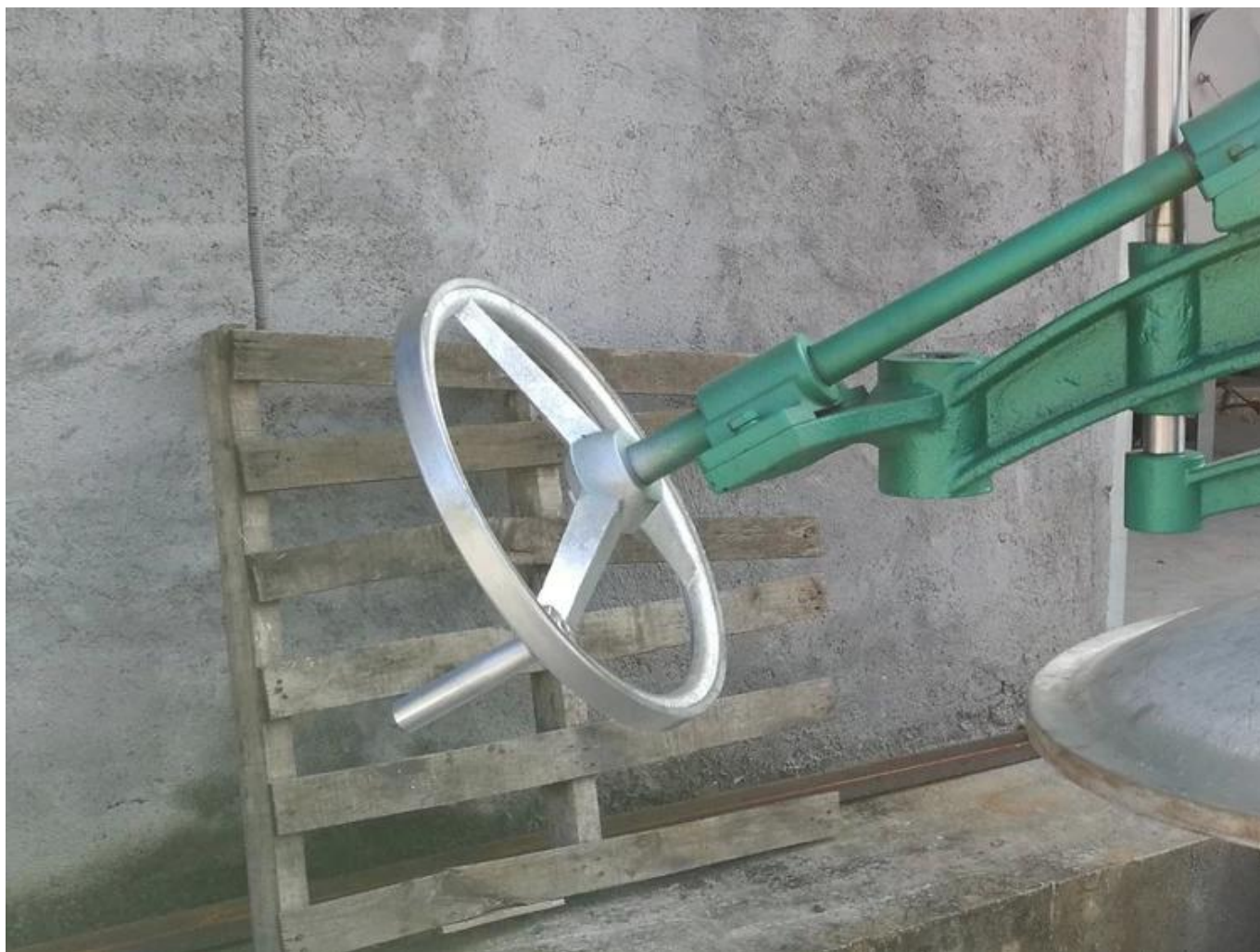
Diseño de volante agrandado, levantamiento más rápido de la tapa del cañón.