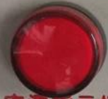
电源指示灯 Power LED